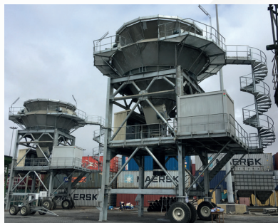
Ghana - 2 hoppers Products : Clinker, Gypsum Capacity : 500t/h Filter bags On wheels