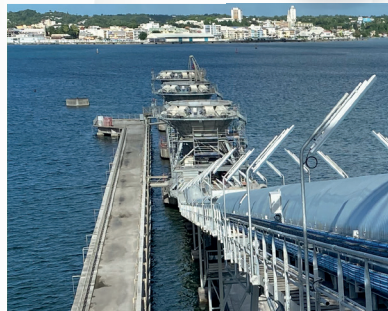
France - 3 hoppers Products : Clinker, Coal, Wood pellets Capacity : 300 t/h Filter bags Fixed