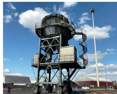
France - 1 hopper Products : Clinker, Gypsum Capacity : 500 t/h Filter bags On wheels