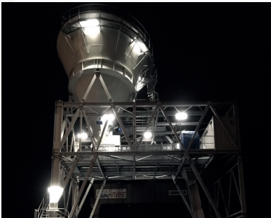
Poland - 3 hoppers Products : Coal, Iron Ore Capacity : 3 800 t/h Spraying On rails