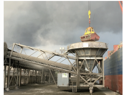
Cameroon - 3 hoppers Products : Clinker, Gypsum Capacity : 300 t/h Filter bags On rails